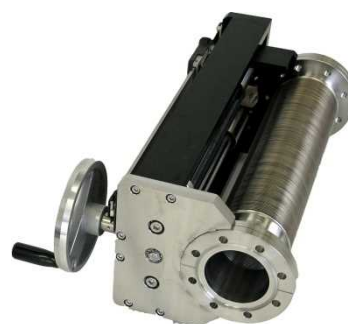
φ114CF 特型 (サイドハンドル) タイプ