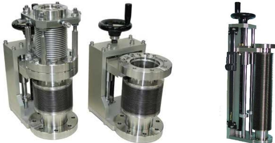
114CFフランジタイプと簡易型XY機構の組み合わせ（左）